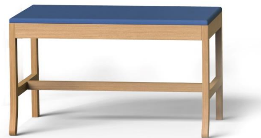
BIG JIM, panca L80 H48.